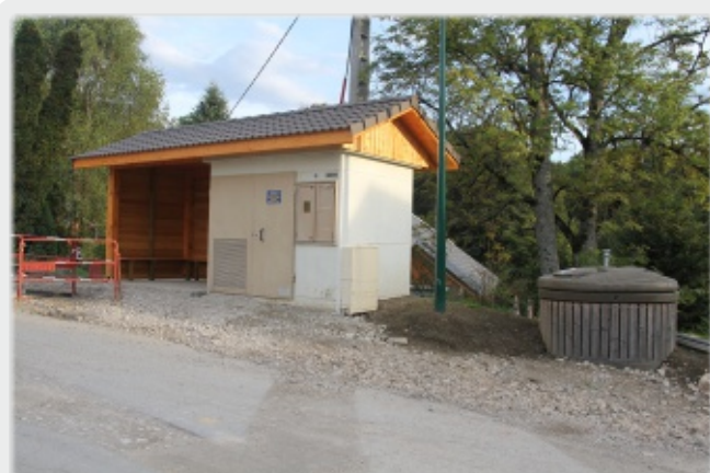
Abribus des Petits Pierres et container à ordures ménagères