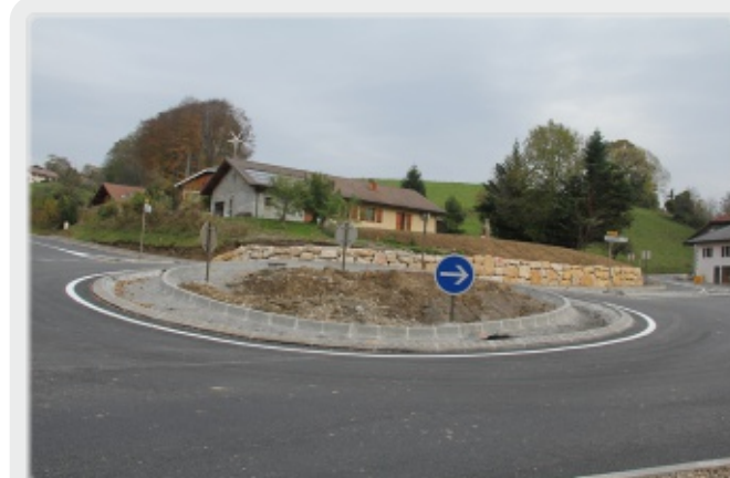
Rond-point des Petits Pierres le 1er novembre 2013