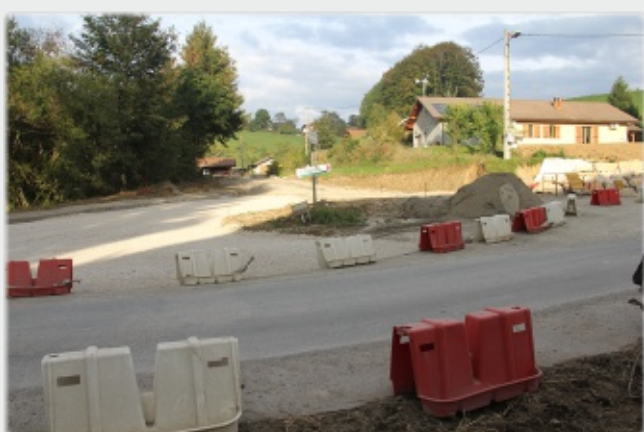
Rond-point des Petits Pierres le 3 octobre 2013