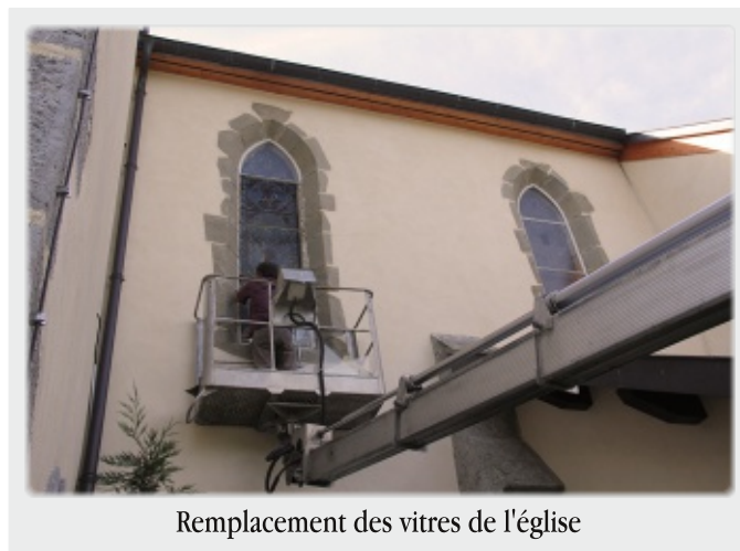
Remplacement des vitres de l'église