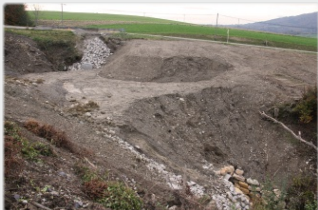
Busage du ruisseau de Morges à l'entrée du chef-lieu