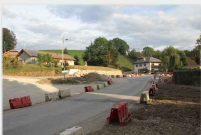
Rond-point des Petits Pierres le 3 octobre 2013