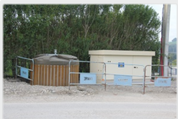
Les Petits Pierres