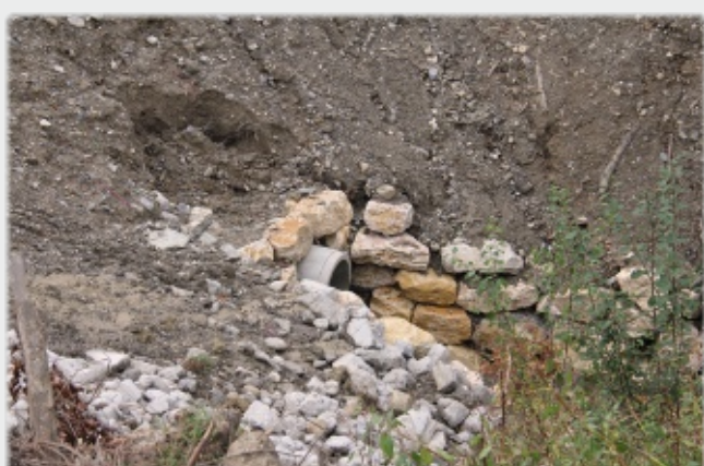
Busage du ruisseau de Morges à l'entrée du chef-lieu