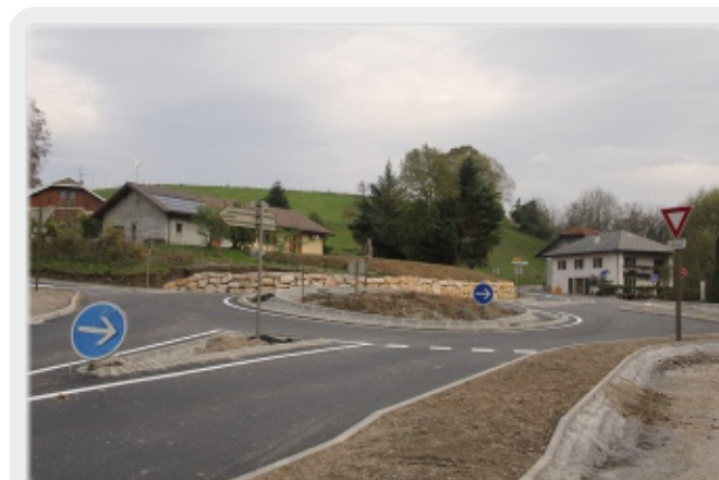
Rond-point des Petits Pierres le 1er novembre 2013