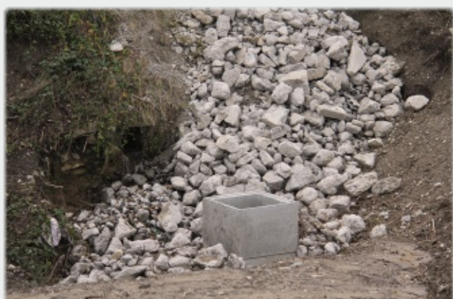
Busage du ruisseau de Morges à l'entrée du chef-lieu