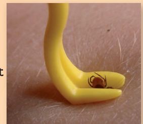
Par Otom (Travail personnel)