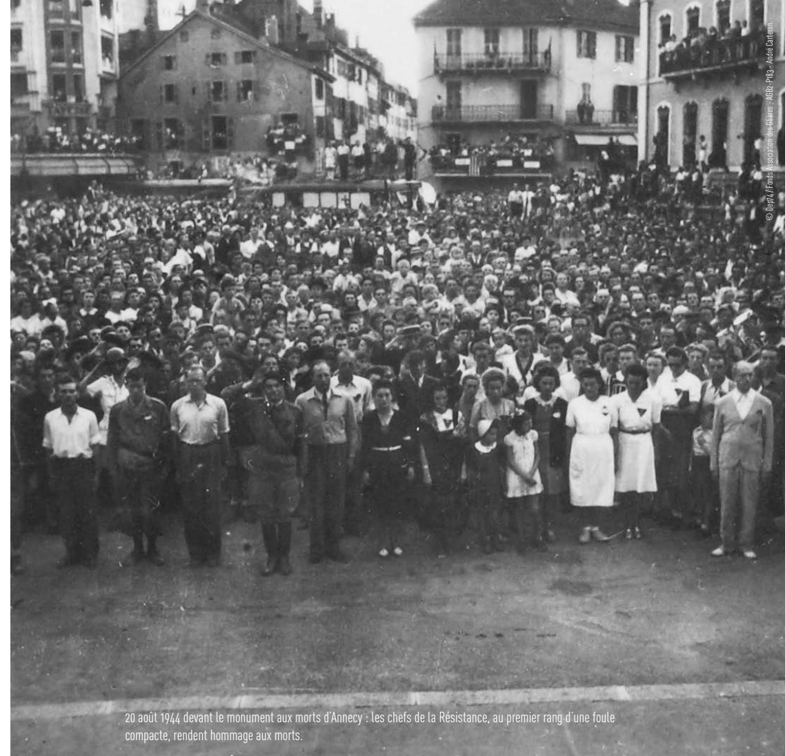
20 août 1944, devant le monument aux morts d'Annecy : les chefs de la Résistance, au premier rang d'une foule compacte, rendent hommage aux morts.

Par le Général d'armée (2S) Jean-René BACHELET Commandant le 27 e bataillon de chasseurs alpins (1987-1989) Inspecteur général des armées (2002-2004) Président de l'Association des Glières (2005-2017)