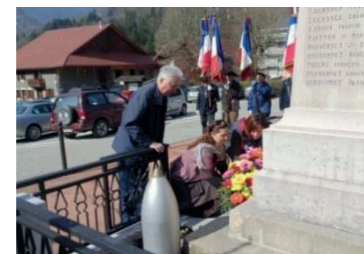
La Balme-de-Thuy - La Belle Inconnue

Ces cérémonies saluent la mémoire de ces jeunes combattants tombés au cours du printemps 1944 pour que la France puisse retrouver la liberté.