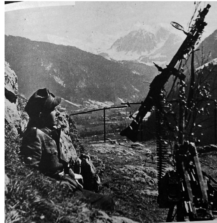
Soldat allemand au Crêt de la Fenêtre (au-dessus des fouilles préhistoriques) regardant Cruet.

À l'occasion du 75 e anniversaire de la libération de la Haute-Savoie, seront inaugurés le nom de la place du monument aux morts « Placette du 26 janvier 1944 », et deux stèles retraçant pour l'une les événements du 26 janvier 1944, pour l'autre l'importance qu'a tenu le village de la Balme-de-Thuy dans l'histoire du Maquis de Glières.