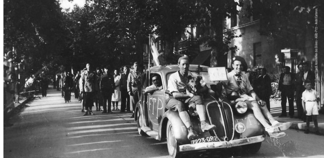
Un groupe de maquisards FTP lors de la Libération d'Annecy le 19 août 1944.

Les militaires d'active du 27 e BCA, reconstitué en juillet 40 sous l'autorité d'un chef d'exception, le chef de bataillon Vallette d'Osia, sont, pour ce qui les concerne, convaincus que la « collaboration » explicitement engagée par le maréchal dès l'automne 40, n'est que ruse de guerre et que leur mission est de préparer la revanche.