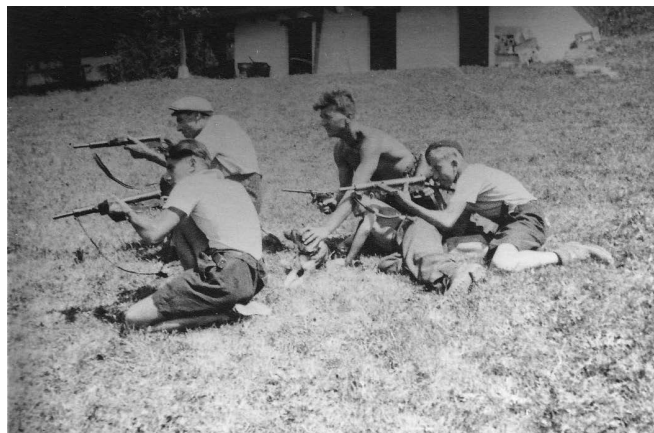
Hommes de la Patrouille Blanche, maquis des Carroz d'Arâches.

Début de la cérémonie à 10h sur la place de l'Hôtel de ville, en présence des autorités civiles et militaires, d'élus et de la population. Défilé et dépôt de gerbe au monument aux morts.