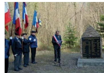
Dingy-Saint-Clair - Monument aux morts