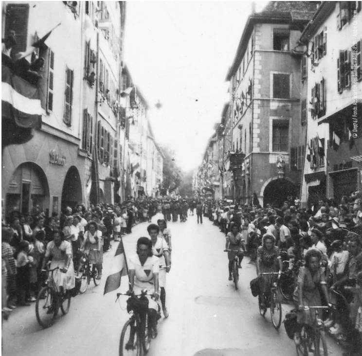
Les agents de liaison féminins ouvrent le défilé rue du Pâquier, le 20 août 1944.

Lorsqu'en janvier 1942 Jean Moulin est parachuté pour accomplir en France occupée la mission d'unification des forces de la Résistance que lui a donnée le général de Gaulle, il séjourne à Menthon-Saint-Bernard. C'est à François de Menthon qu'il confie la responsabilité du Comité des Experts,