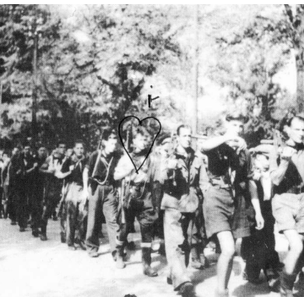
Défilé de maquisards à Cluses.