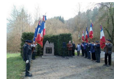
Thônes - Le Villaret